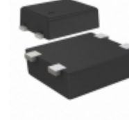
S-80953CNPf-G9PTFG SII Semiconductor Corporation IC VOLT DETECTOR 5.3V SNT-4A