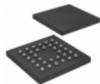
ATMEGA88A-CCU Microchip Technology IC MCU 8BIT 8KB FLASH 32UFBGA