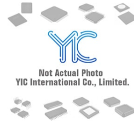
ATA5279P-PLQW ATMEL ATA5279P-PLQW ATMEL