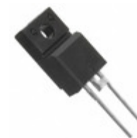
FESE16FT-E3/45 Electro-Films (EFI) / Vishay DIODE GEN PURP 300V 16A TO220AC