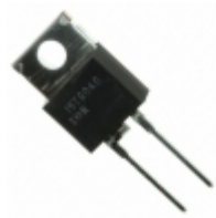
FESE8DT-E3/45 Vishay Semiconductor Diodes Division DIODE GEN PURP 200V 8A TO220AC