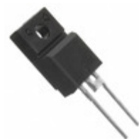
FESE8DT-E3/45 Electro-Films (EFI) / Vishay DIODE GEN PURP 200V 8A TO220AC