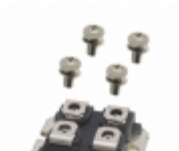
IXFN94N50P2 IXYS 500V POLAR2 HIPERFETS