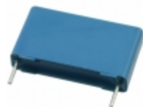
B32923C3334M EPCOS (TDK) CAP FILM 0.33UF 20% 305VAC RAD