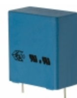
B32923C3225K000 EPCOS CAP FILM 2.2UF 10% 305VAC RADIAL