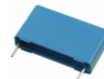
B32923C3224M289 EPCOS (TDK) CAP FILM 0.22UF 20% 305VAC RAD