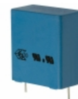
B32923C3225K EPCOS (TDK) CAP FILM 2.2UF 10% 305VAC RADIAL