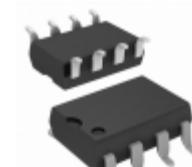
HCPL-J314-300E Broadcom Limited OPTOISO 3.75KV GATE DRVR 8DIP GW