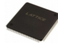
LC4384V-5T176C Lattice Semiconductor Corporation IC CPLD 384MC 5NS 176TQFP