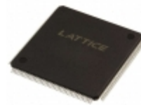
LC4384V-5TN176I Lattice Semiconductor Corporation IC CPLD 384MC 5NS 176TQFP