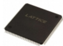
LC4384V-5TN176C Lattice Semiconductor Corporation IC CPLD 384MC 5NS 176TQFP