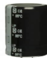
ECE-S2GP471EX Panasonic Electronic Components CAP ALUM 470UF 20% 400V SNAP