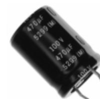
ECE-S2AG471E Panasonic Electronic Components CAP ALUM 470UF 20% 100V SNAP