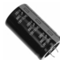
ECE-S2EU681U Panasonic Electronic Components CAP ALUM 680UF 20% 250V SNAP