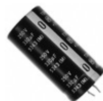
ECE-S2EG331N Panasonic Electronic Components CAP ALUM 330UF 20% 250V SNAP