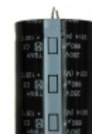
ECE-S2EG681Z Panasonic Electronic Components CAP ALUM 680UF 20% 250V SNAP