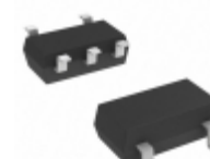
S-814A38AMC-BDCT2G SII Semiconductor Corporation IC REG LDO 3.8V 0.11A SOT23-5