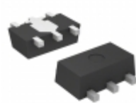
S-814A36AUC-BDAT2G SII Semiconductor Corporation IC REG LDO 3.6V 0.11A SOT89-5