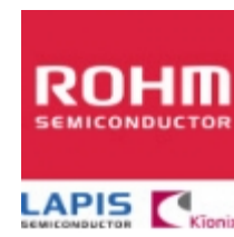
BD4826FVE ROHM BD4826FVE ROHM