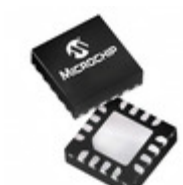
PIC16LF1575-I/JQ Microchip Technology IC MCU 8BIT 14KB FLASH 16UQFN