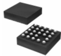
BD6581GU-E2 Rohm Semiconductor IC LED DRIVER CTRLR DIM VCSP85H2