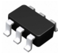
BD6551G-TR Rohm Semiconductor IC BATTERY CONTROLLER 6- SSOP