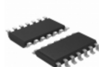
T6818-TUQ Microchip Technology IC DRIVER TRPL HALFBRIDGE 14SOIC