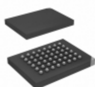
SST38VF6402-90-5I-B3KE Microchip Technology IC FLASH 64MBIT 90NS 48TFBGA