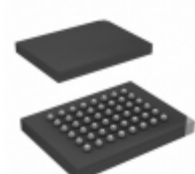
SST38VF6402-90-5C-B3KE Microchip Technology IC FLASH 64MBIT 90NS 48TFBGA