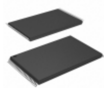
SST38VF6401BT-70I/TV Microchip Technology IC FLASH 64MBIT 70NS 48TSOP