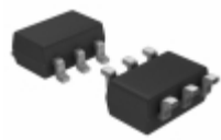
MIC5321-MKYD6-TR Microchip Technology IC REG LDO 2.8V/2.6V TSOT23-6