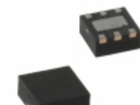
MIC5321-MFYMT-TR Microchip Technology IC REG LDO 2.8V/1.5V 0.15A 6TMLF