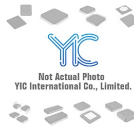
AT28C010E-12DM/883 ATMEL ATMEL DIP