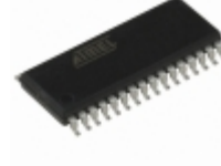
AT28C010-25SI Microchip Technology IC EEPROM 1MBIT 250NS 32SOIC