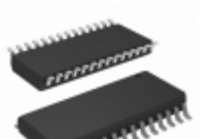
AT27BV256-70RI Microchip Technology IC OTP 256KBIT 70NS 28SOIC