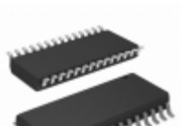
AT27BV256-70RU Microchip Technology IC OTP 256KBIT 70NS 28SOIC