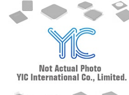
DTC044EEB ROHM DTC044EEB ROHM