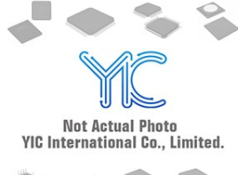
DTC043ZUB FS8TL ROHM DTC043ZUB FS8TL ROHM