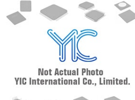
DTC044EM T2L ROHM DTC044EM T2L ROHM