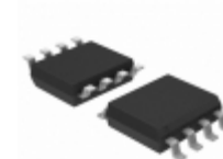
TC1266VOATR Microchip Technology IC REG LDO 3.3V 200MA PCI 8SOIC