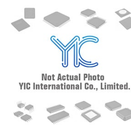
MAX4701EUE MAXIM MAX4701EUE MAXIM