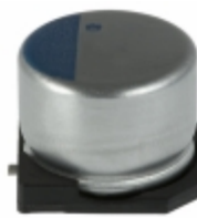
APXA160ARA3R3MD55G United Chemi-Con CAP ALUM POLY 3.3UF 20% 16V SMD