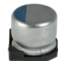
APXA160ARA390MF55G United Chemi-Con CAP ALUM POLY 39UF 20% 16V SMD