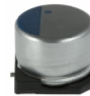
APXA200ARA151MJC0G United Chemi-Con CAP ALUM POLY 150UF 20% 20V SMD