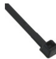
CT6BK30-M 3M 6" BLACK 30LB CABLE TIE