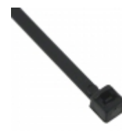
CT6BK18-C 3M 6" BLACK 18LB CABLE TIE