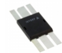
IXZ316N60 IXYS RF RF MOSFET N-CHANNEL DE375