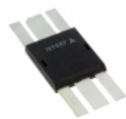
IXZ308N120 IXYS RF MOSFET N-CHANNEL DE375