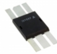
IXZ210N50L2 IXYS RF RF MOSFET N-CHANNEL DE275