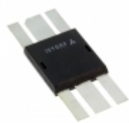
IXZ316N60 IXYS RF MOSFET N-CHANNEL DE375