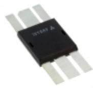
IXZ308N120 IXYS RF MOSFET N-CHANNEL DE375