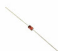
1N4735A-T50A AMI Semiconductor / ON Semiconductor DIODE ZENER 6.2V 1W DO41