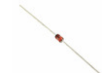
1N4735A-T50R AMI Semiconductor / ON Semiconductor DIODE ZENER 6.2V 1W DO41