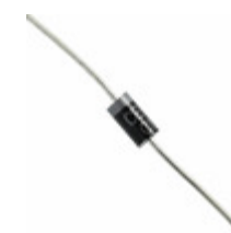
1N4735A TR Central Semiconductor Corp DIODE ZENER 6.2V 1W DO41