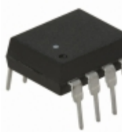
HCNW4502-000E Broadcom Limited OPTOISOLATOR 5KV TRANSISTOR 8DIP