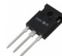
C3D20060D Cree/Wolfspeed DIODE ARRAY SCHOTTKY 600V TO247