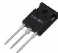
C3D20060D Cree Wolfspeed DIODE ARRAY SCHOTTKY 600V TO247