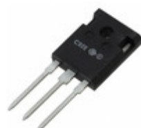
C3D20065D Cree Wolfspeed DIODE ARRAY SCHOTTKY 650V TO247