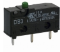
DB3CC1AA ZF Electronics SWITCH SNAP ACT SPDT 100MA 125V