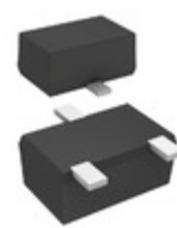
DB3J314F0L Panasonic Electronic Components DIODE ARRAY SCHOTTKY 30V SMINI3