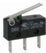
DB3CB1LB ZF Electronics SWITCH SNAP ACT SPDT 100MA 125V