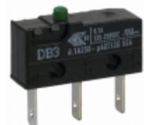
DB3CB1AA ZF Electronics SWITCH SNAP ACT SPDT 100MA 125V