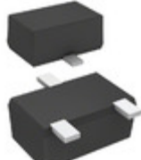
DB3J313K0L Panasonic Electronic Components DIODE SCHOTTKY 30V 200MA SMINI3