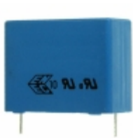
B32924C3475M000 EPCOS CAP FILM 4.7UF 20% 305VAC RADIAL