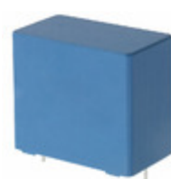
B32924C3335M EPCOS (TDK) CAP FILM 3.3UF 20% 305VAC RADIAL