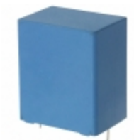
B32924C3565K EPCOS (TDK) CAP FILM 5.6UF 10% 305VAC RADIAL