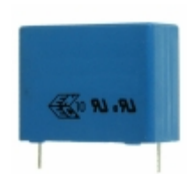
B32924C3225M000 EPCOS CAP FILM 2.2UF 20% 305VAC RADIAL