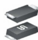
SMF64AHRVG TSC (Taiwan Semiconductor) DIODE, TVS, UNIDIRECTIONAL, 200W