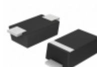
SMF64AT1G ON Semiconductor TVS DIODE 64VWM 103VC SOD123FL