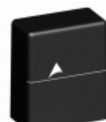
B72220T2271K105 EPCOS (TDK) VARISTOR 430V 10KA ENCASED