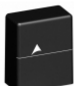
B72220T2151K105 EPCOS (TDK) VARISTOR 240V 10KA ENCASED