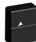
B72220T2231K105 EPCOS (TDK) VARISTOR 360V 10KA ENCASED