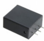
B72220T2171K101 EPCOS VARISTOR 270V 10KA RADIAL