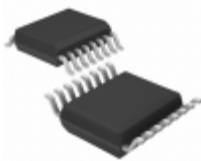
PS392EEE Diodes Incorporated IC ANLG SW SPST QUAD NO 16-QSOP