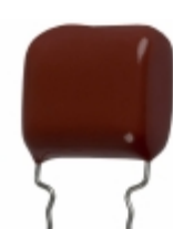
ECQ-P1H184GZW Panasonic Electronic Components CAP FILM 0.18UF 2% 50VDC RADIAL