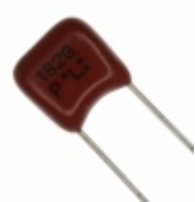
ECQ-P1H182GZ Panasonic Electronic Components CAP FILM 1800PF 2% 50VDC RADIAL