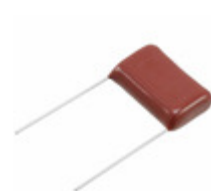
ECQ-E6394KF Panasonic Electronic Components CAP FILM 0.39UF 10% 630VDC RAD