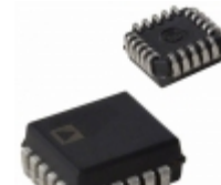
AD7820KP Analog Devices Inc. IC ADC 8BIT HS TRACK/HOLD 20PLCC