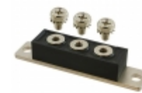
MURT10010 GeneSiC Semiconductor DIODE MODULE 100V 100A 3TOWER