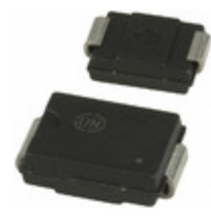
MURS480ET3G ON Semiconductor DIODE GEN PURP 800V 4A SMC