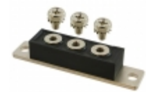
MURT10020 GeneSiC Semiconductor DIODE ARRAY GP 200V 100A 3TOWER