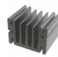
V5583C ASSMANN WSW Components HEATSINK ALUM ANOD