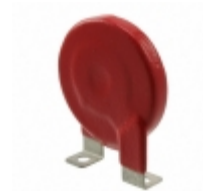
V551HA40 Littelfuse Inc. VARISTOR 863.5V 40KA DISC 40MM