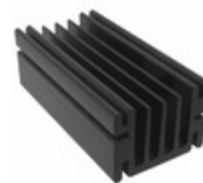
V5583K ASSMANN WSW Components HEATSINK ALUM ANOD