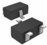
RSB39F2FHT106 LAPIS Semiconductor BI-DIRECTIONAL ZENER DIODES (COR)