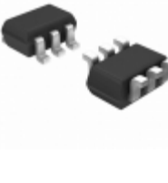
DG4157EDL-T1-GE3 Electro-Films (EFI) / Vishay IC ANALOG SWITCH SC70-6