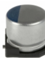
APXC100ARA820MF60G United Chemi-Con CAP ALUM POLY 82UF 20% 10V SMD