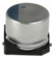
APXC100ARA151MH70G United Chemi-Con CAP ALUM POLY 150UF 20% 10V SMD