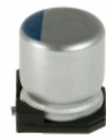
APXC160ARA270ME60G United Chemi-Con CAP ALUM POLY 27UF 20% 16V SMD