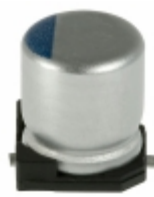
APXC2R5ARA181ME60G United Chemi-Con CAP ALUM POLY 180UF 20% 2.5V SMD