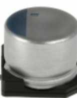
APXC160ARA820MH70G United Chemi-Con CAP ALUM POLY 82UF 20% 16V SMD