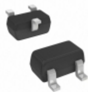
BAT54T-7 Diodes Incorporated DIODE SCHOTTKY 30V 200MA SOT523