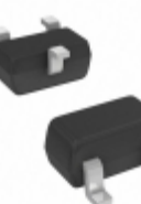
BAT54T-7-F Diodes Incorporated DIODE SCHOTTKY 30V 200MA SOT523