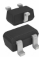
BAT54T,115 NXP USA Inc. DIODE SCHOTTKY 30V 200MA SC75