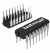
ICL232MJE Intersil IC 2DRVR/2RCVR RS232 5V 16-DIP