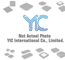
ICL3078EIBZ INTERSIL INTERSIL SOP-8