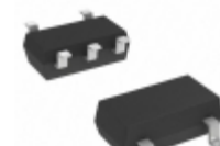
S-80946CNMC-G9GT2U SII Semiconductor Corporation IC VOLT DETECTOR 4.6V SOT23-5