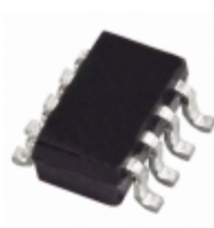
AD8034ARTZ-REEL7 Analog Devices Inc. IC OPAMP VFB 80MHZ RRO SOT23-8