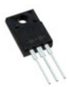
TSM60NB260CI C0G TSC (Taiwan Semiconductor) MOSFET N-CH 600V 13A ITO220