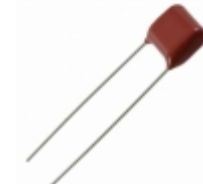
ECQ-E6273JFB Panasonic Electronic Components CAP FILM 0.027UF 5% 630VDC RAD