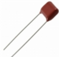
ECQ-E6273JF9 Panasonic Electronic Components CAP FILM 0.027UF 5% 630VDC RAD