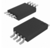
AT25160B-TH-T Micrel / Microchip Technology IC EEPROM 16KBIT 20MHZ 8TSSOP