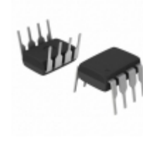
AT25160B-PU Micrel / Microchip Technology IC EEPROM 16KBIT 20MHZ 8DIP