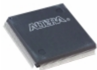
EPF10K100EQC208-1 Altera IC FPGA 147 I/O 208QFP