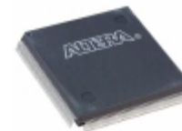
EPF10K100EQC208-2 Altera IC FPGA 147 I/O 208QFP