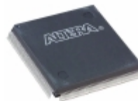
EPF10K100EQC208-2N Altera IC FPGA 147 I/O 208QFP