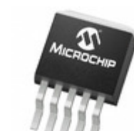
MCP1827T-5002E/ET Microchip Technology IC REG LDO 5V 1.5A DDPAK