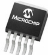
MCP1827T-0802E/ET Microchip Technology IC REG LDO 0.8V 1.5A DDPAK