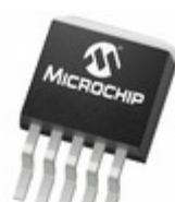
MCP1827T-ADJE/ET Microchip Technology IC REG LDO ADJ 1.5A DDPAK