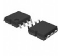
BR93G56FJ-3GTE2 LAPIS Semiconductor MICROWIRE BUS 2KBIT(128X16BIT) E